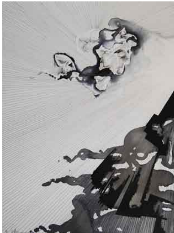
studija oblaka #5 / olovka na papiru studio di nuvole #5 / matita su carta study of clouds #5 / pencil on paper