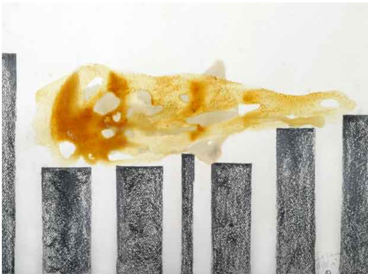
studija statike #2 / kombinirana tehnika na papiru studio di statica #2 / tecnica mista su carta study of statics #2 / combined technique on paper