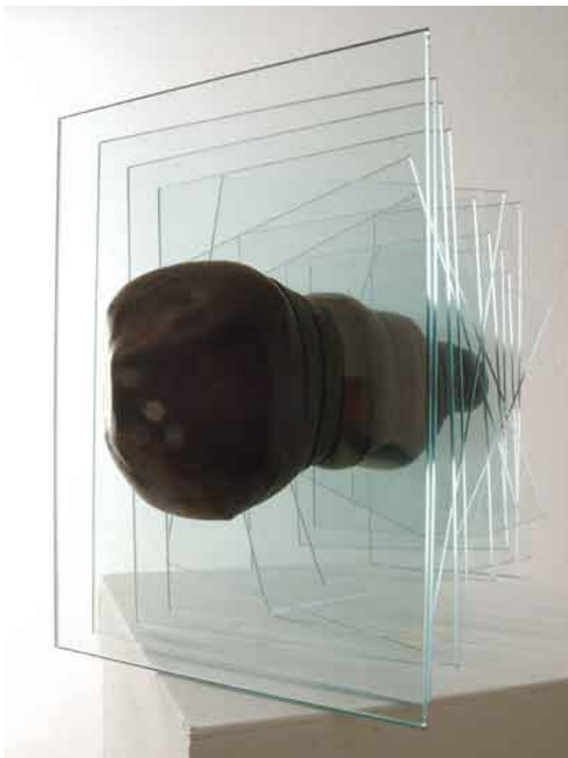
dvodimenzionalna skulptura #3 / kombinirana tehnika scultura bidimensionale #3 / tecnica mista two-dimensional sculpture #3 / combined technique