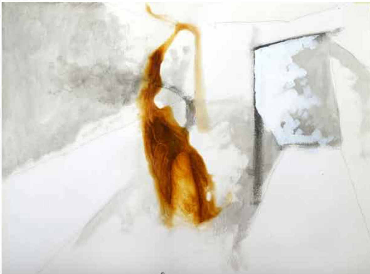
dvodimenzionalna skulptura #2 / kombinirana tehnika na papiru scultura bidimensionale #2 / tecnica mista su carta two-dimensional sculpture #2 / combined technique on paper