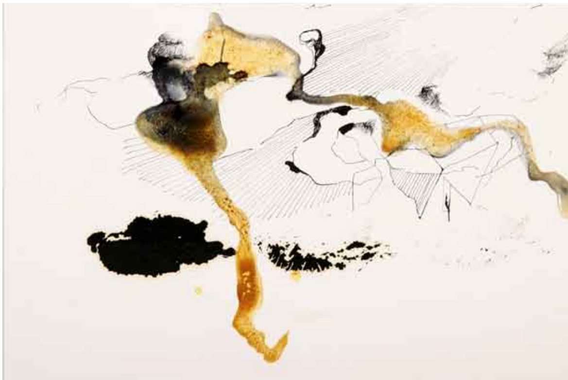
studija oblaka + stvar / kombinirana tehnika na papiru studio di nuvole + cosa / tecnica mista su carta study of clouds + thing / combined technique on paper