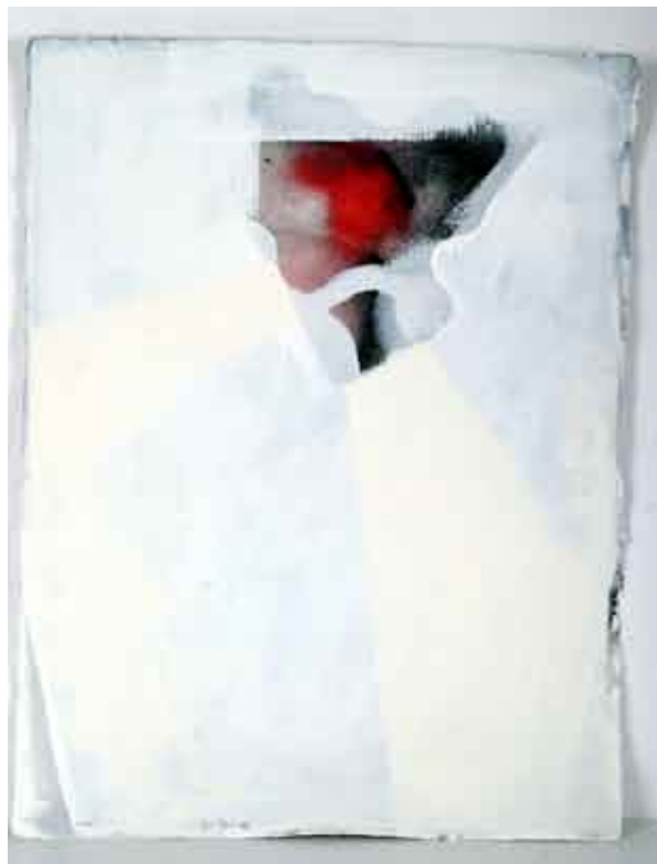
statika #1 / kombinirana tehnika na papiru statika #1 / tecnica mista su carta statics #1 / combined technique on paper