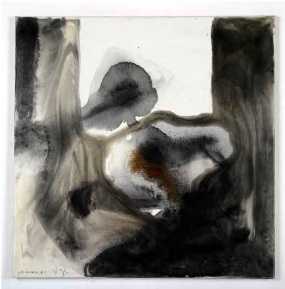
organsko slikarstvo #3 / organsko slikarstvo, kombinirana tehnika na platnu pittura organica #3 / pittura organica, tecnica mista su tela organic painting #3 / organic painting, combined technique on canvas