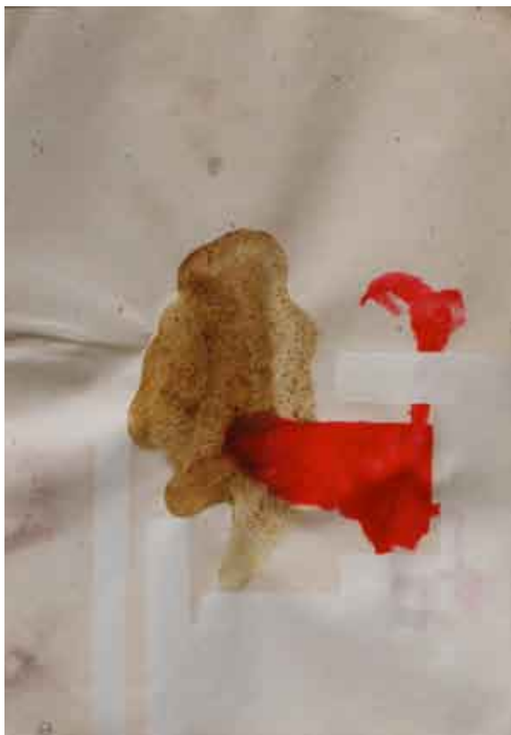
organska statika #1 / kombinirana tehnika na papiru statica organica #1 / tecnica mista su carta organic statics #1 / combined technique on paper