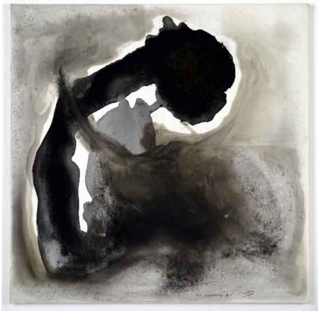
organsko slikarstvo #1 / organsko slikarstvo, kombinirana tehnika na platnu pittura organica #1 / pittura organica, tecnica mista su tela organic painting #1 / organic painting, combined technique on canvas