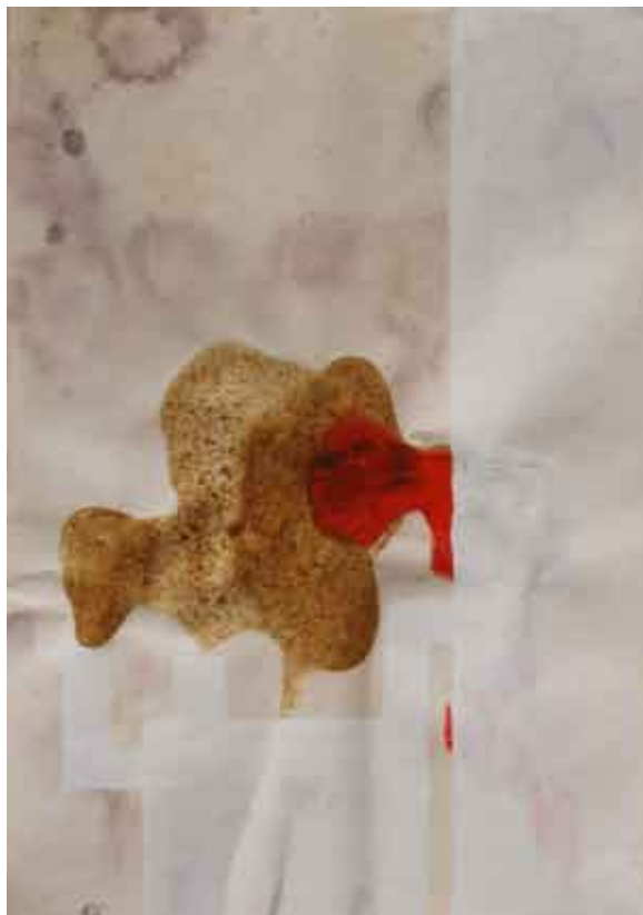
21 x 29 cm 2007