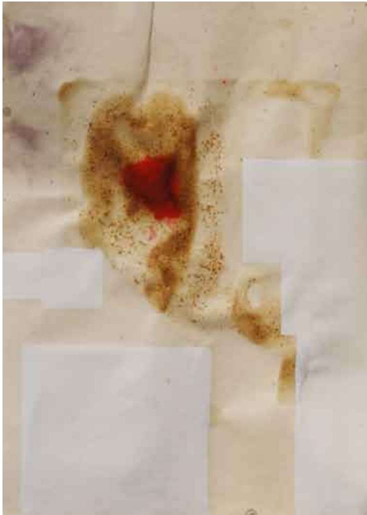
organska statika #3 / kombinirana tehnika na papiru static organica #3 / tecnica mista su carta organic statics #3 / combined technique on paper