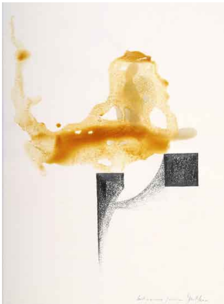
studija statike #1 / kombinirana tehnika na papiru studio di statica #1 / tecnica mista su carta study of statics #1 / combined technique on paper