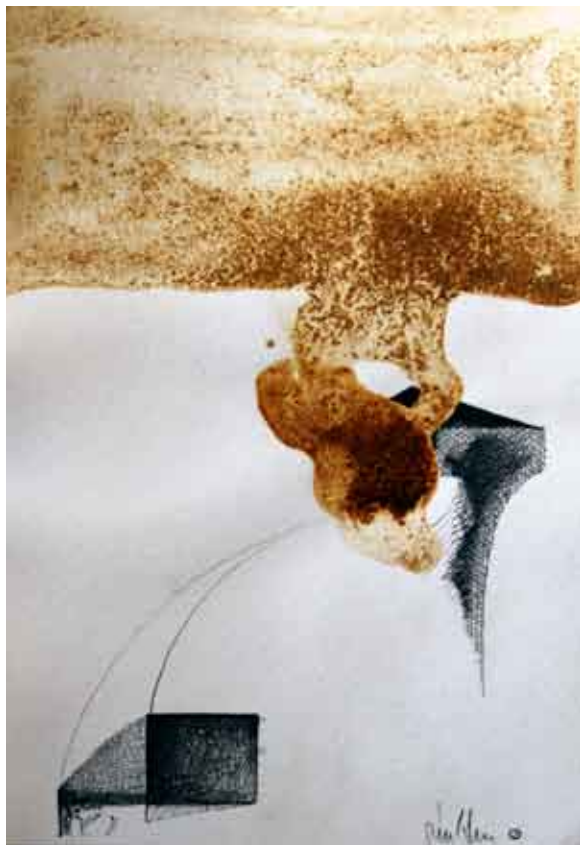
nosivi elementi #1 / kombinirana tehnika i olovka na papiru elementi portanti #1 / tecnica mista e matita su carta bearing elements #1 / combined technique and pencil on paper