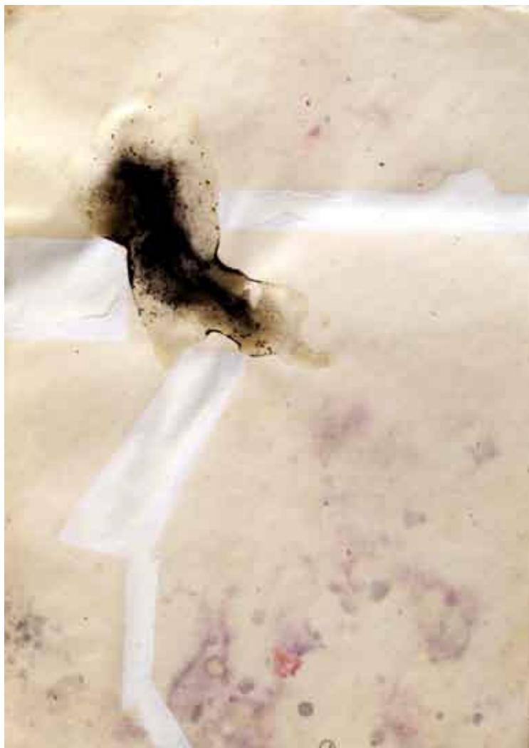
statika hrda #1 / kombinirana tehnika na papiru statica ruggine #1 / tecnica mista su carta rust statics #1 / combined technique on paper