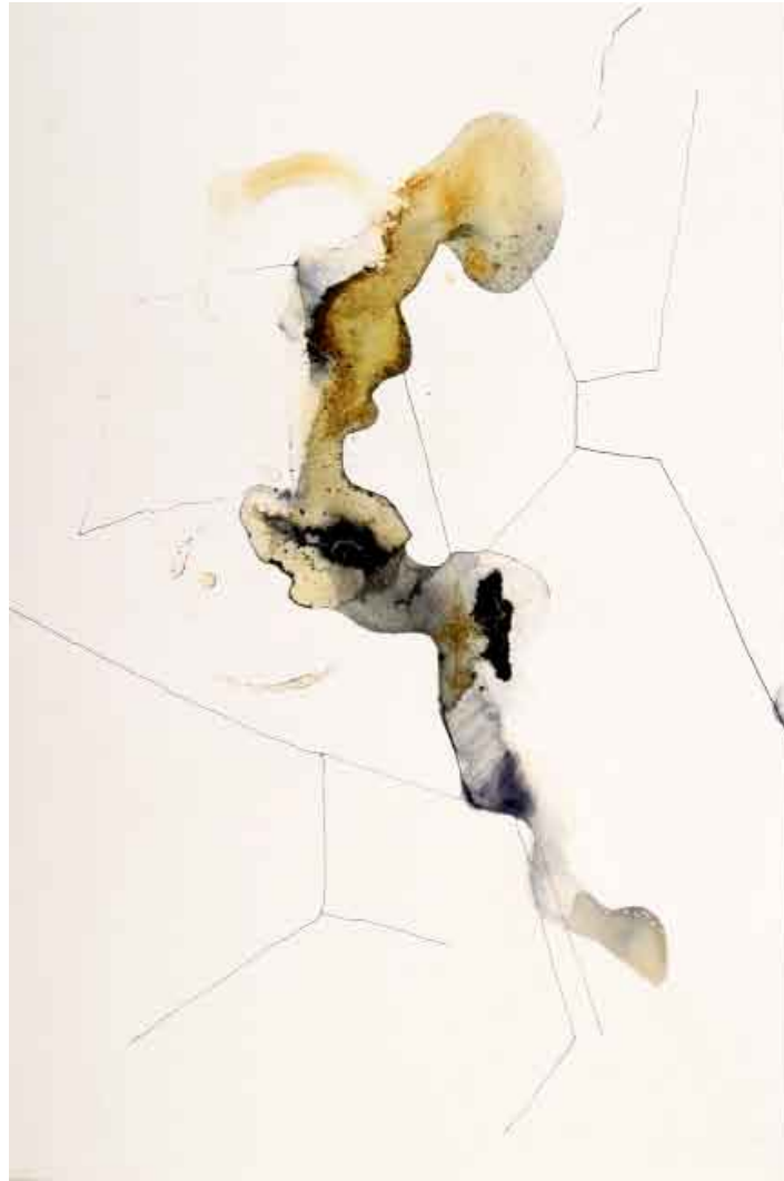
stvar + interijer / kombinirana tehnika na papiru cosa + interno / tecnica mista su carta thing + interior / combined technique on paper