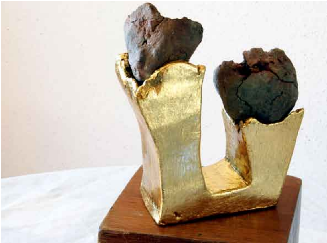
statika #1/ kombinirana tehnika statica #1 / tecnica mista statics #1 / combined technique