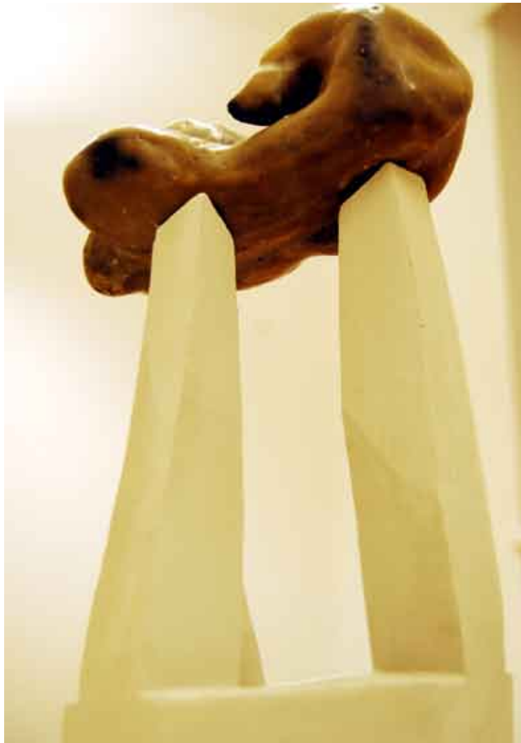
statika #2 / kombinirana tehnika statica #2 / tecnica mista statics #2 / combined technique