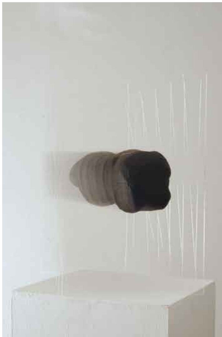
dvodimenzionalna skulptura #4 / kombinirana tehnika scultura bidimensionale #4 / tecnica mista two-dimensional sculpture #4 / combined technique