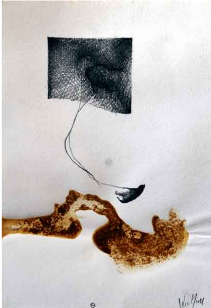
nosivi elementi #3 / kombinirana tehnika i olovka na papiru elementi portanti #3 / tecnica mista e matita su carta bearing elements #3 / combined technique and pencil on paper