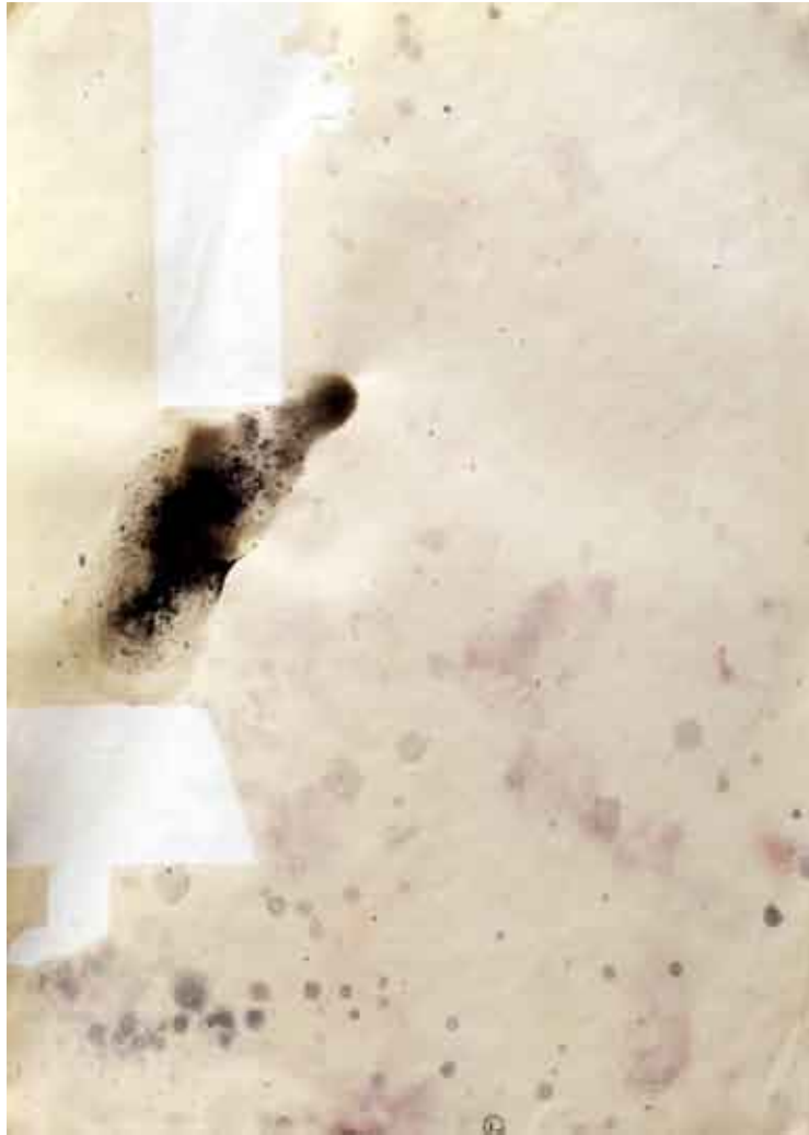
statika hrda #2 / kombinirana tehnika na papiru statica ruggine #2 / tecnica mista su carta rust statics #2 / combined technique on paper