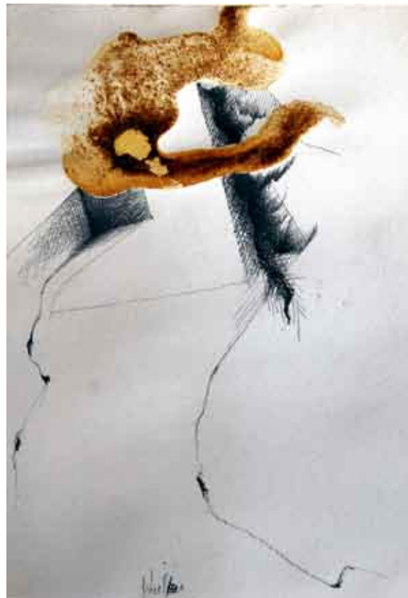
nosivi elementi #2 / kombinirana tehnika i olovka na papiru elementi portanti #2 / tecnica mista e matita su carta bearing elements #2 / combined technique and pencil on paper