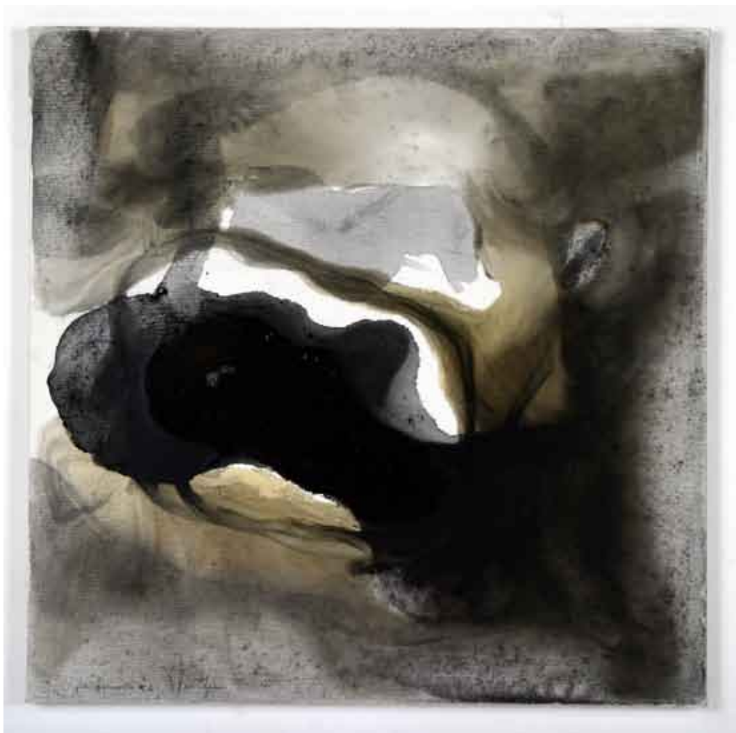
organsko slikarstvo #2 / organsko slikarstvo, kombinirana tehnika na platnu pittura organica #2 / pittura organica, tecnica mista su tela organic painting #2 / organic painting, combined technique on canvas